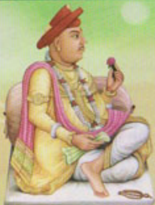
प.पू.प.पु. आदि आचार्य श्री रघुवीरप्रसादजी महाराज