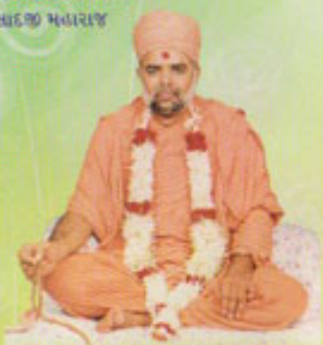
महामंत्र महोत्सवना अध्यायश्री सद्. सा. श्री आलकृष्णदासजी स्वामी