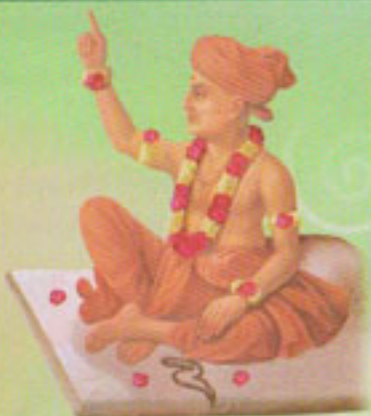
सर्वोपरी उपासना उद्घोषक सद्. श्री गुप्तानीतानंद स्वामी